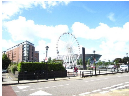
圖 8.8 亞伯特碼頭至碼頭頂人行步道 圖 8.9 亞伯特碼頭南端的 ACC Liverpool

從近年來的現象也可觀察到，參觀博物館已成為觀光客主要的訴求之一，舉例來說，在 1990 年的統計數據中，前往倫敦參觀博物館的觀光客占倫敦觀光客總數的 44% (Garcia, 2003)。四大博物館同樣也在亞伯特碼頭的觀光價值中扮演了重要角色。國際博物館協會 (ICOM, the International Council of Museums) 對博物館的最新定義為「一個非營利的、服務社會與其發展的永久性機構、並開放給大眾，擁有、保存、研究、傳達與展示人類與其環境的有形和無形資產，目的