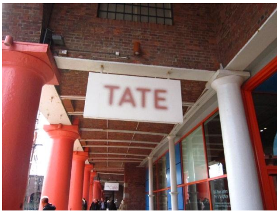
圖 8.5 泰德利物浦美術館

披頭四是利物浦最鮮明的流行文化代表，歌迷遍及全球，但是對利物浦市民來說，他們對披頭四已經再熟悉不過而視之為理所當然，反而沒有如歌迷般熱衷，而披頭四故事館主要也是以觀光客為導向。然而看到披頭四故事館吸引如此廣大的群眾前來利物浦，隨著利物浦的觀光逐漸步上軌道，民眾也開始重新認識披頭四，承認他們的特殊，並以他們為傲。