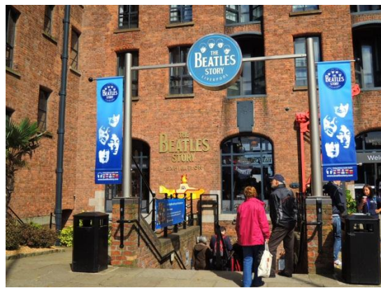
圖 8.6 披頭四故事館