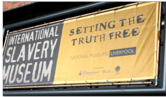
圖 8.4 國際奴隸博物館 1