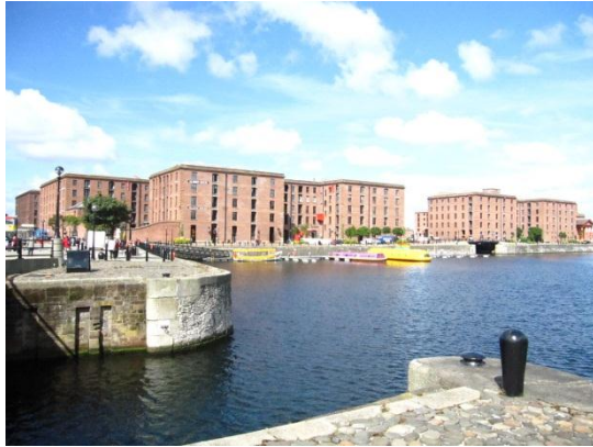
圖 8.1 亞伯特碼頭外觀