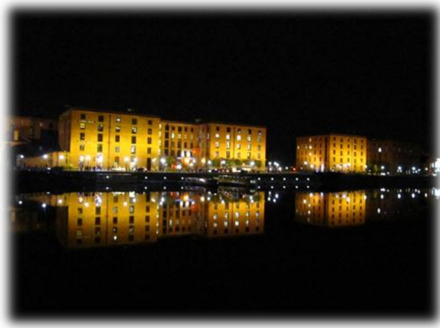
圖 8.7 亞伯特碼頭夜景

方式，在 1984 年舉辦國際園藝節（International Garden Festival），吸引超過兩百萬人潮、達到集客效應，成功改變民眾對亞伯特碼頭往日的破敗形象。日後更引進餐廳、酒吧、咖啡館、兩間連鎖旅館和與商店、紀念品店。夜晚的亞伯特碼頭則霓虹閃爍，餐廳酒吧紛紛成為年輕人夜間娛樂的去處，遊人也可見識到亞伯特碼頭的另一種風情，燈光映照水面倒影的夜景也使亞伯特碼頭晚間的美成為它另一項可被觀光客消費的資產。