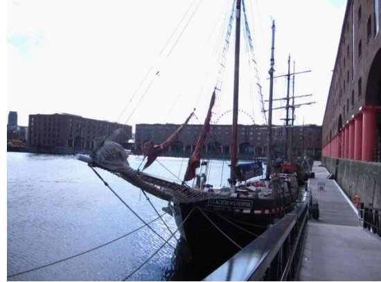
圖 8.2 亞伯特碼頭內港

「博物館猶如一面鏡子，反映社會從過去到現在的發展與文化。」(Gonçalves, 2007, p.3)。除此之外，任何博物館或是遺產組織的功能也在於對其展示的詮釋與解釋，而這部分的經營管理與大眾以及社會層面有較密切的關係(Hernández & Tresseras, 2001)。可推論出，博物館或文化遺產除了必須透過有效、使人民易於接受與了解的詮釋和解釋，才有機會和立足點去形塑人民對自身文化的認同感，並得到正面的回饋，從而澄清具在地特殊性和獨特價值 (Unique Selling Point)，發展穩定、長久的觀光。亞伯特碼頭四大博物館的其中三座：梅西賽德海事博物館、國際奴隸博物館與披頭四故事館即實踐了這兩個論點；而來自倫敦的著名博物館品牌—泰德利物浦美術館則透過在地化和提供重視民眾藝術養成教育的豐富活動，拉近與利物浦人民的距離，將在接下來的部份討論之。