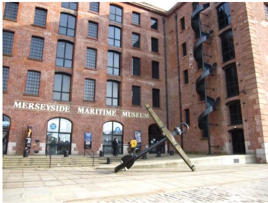
圖 8.3 梅西賽德海事博物館