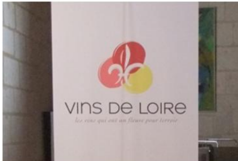
圖 5.4 昂傑市區之葡萄酒推廣行銷暨教育中心，提供多國語言之品酒和葡萄酒植栽文化及行銷等相關課程。