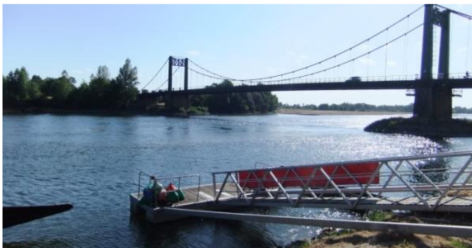
圖 5.1 羅瓦河谷地所擁有的自然美景，賦予了當地葡萄酒特有的風土（Terroir），更成功的定位其葡萄酒所擁有的天然香醇品質。

如表一所示，水行性策略聯盟包含其他酒莊或酒窖以及大小酒商等葡萄酒經銷業者，這些平行性的商業團體，利用彼此不同的葡萄酒種類與特性，提供了整個羅瓦河谷地葡萄酒的多樣性。其中最有名的是來自昂傑的玫瑰酒（Rosé），而此區的白酒產量也為法國之冠。其他策略包括了葡萄酒文化節慶的籌劃、鄰近地區酒莊口耳相傳之聯合行銷策略、以及與地區大學等觀光職業訓練中心或高等教育機構的顧客市場調查。而在垂直性聯合策略方面，則包含了與其他產業的合作。例如：國內外旅行業者所規劃之套裝行程、為消費者量身定做的觀光酒線、與城堡改建之民宿業者結合所提供的另類住宿體驗、與餐廳業者所聯合籌辦之婚禮或會議等酒席提供、品酒室內所提供之套餐或美食搭配、以及葡萄酒相關周邊商品（如：醒酒器或開瓶器等）的販賣等。從羅瓦河谷地水平與垂直的兩個面向所共構之聯盟策略分析，我們可以一窺法國羅瓦河區酒類觀光行銷之特點，進一步參考其成功要素而應用至台灣酒產業，以期達到提高酒類觀光價值並促進台灣產酒地區之集體意識，進而形塑其目的地獨特意象。