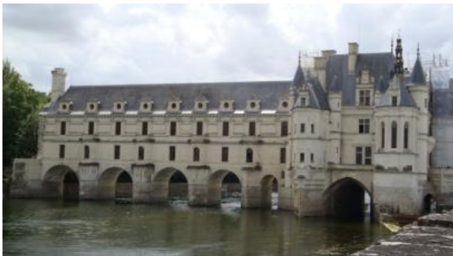
圖 3.2 雪儂瑟堡

“à la Française”意指延續法蘭西斯瓦一世時期的建築風格。雪儂瑟堡位於歇爾河上，在近五百年的歷史中，女人始終是城堡的真正主人，賦予雪儂瑟堡陰柔優美的女性特質，因此雪儂瑟堡又稱為「女人的城堡」。