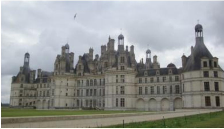
圖 3.1 香波堡

以外觀上來看，城堡主體格局方正而穩重，是義大利古典風格，而屋頂上布滿裝飾繁複的煙囪、老虎窗，是哥德式與義大利文藝復興結合的傑作。城堡內處處可見法蘭西斯瓦一世的紋徽—火蠐螬，是傳說中浴火不死的生物。